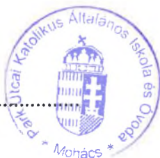
Grätz Ádámné igazgató